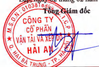
Tạ Mạnh Cường