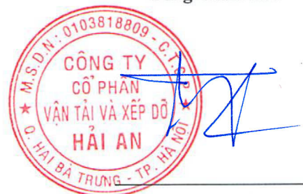
Tạ Mạnh Cường