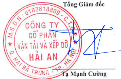
Tạ Mạnh Cường